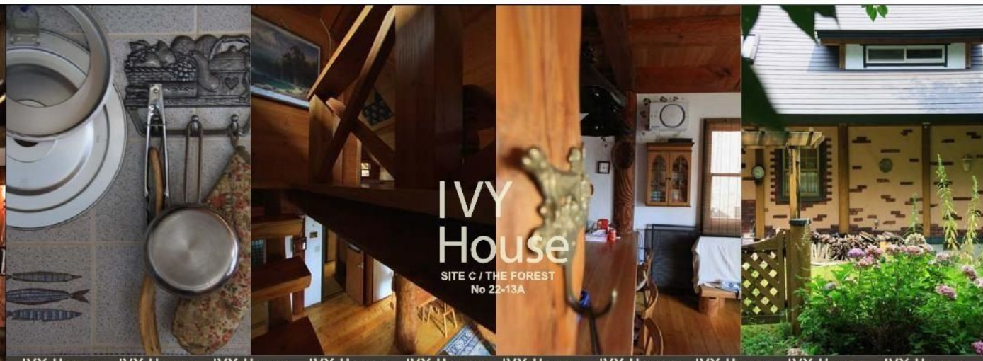
IVY House IVY House IVY House IVY House IVY House IVY House IVY House IVY House IVY House IVY House IVY House